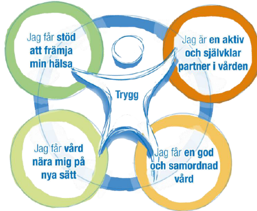
Figur 1: Målbild Hälsa och vård år 2035

Funktionshinderplanen har sin utgångspunkt i strategin Vägen till framtidens hälsa och vård år 2035 där den trygga patienten finns i centrum. Enligt strategin finns fyra områden som alla medverkar till att uppnå en trygg patient.